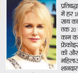
सम्मान को 'सच्चा सम्मान' बतया।

लॉस एंजलिस। हॉलीवुड अभिनेत्री निकोल किडमैन को कान फिल्म फेस्टिवल और केरिंग द्वारा वूम इन मोशन अवॉर्ड से सम्मानित किया जाएगा। निकोल किडमैन को यह अवॉर्ड दिया जाएगा, जिससे उनके फैंस बेहद खुश हैं। वूम इन मोशन पुरस्कार उन महिलाओं को दिया जाता है, जो सिनेमा और समाज में महिलाओं की स्थिति को बेहतर बनाती हैं। पुरस्कार समारोह 18 मई को कान फेस्टिवल में होगा। किडमैन को महिला निर्देशकों के साथ काम करने की उनकी