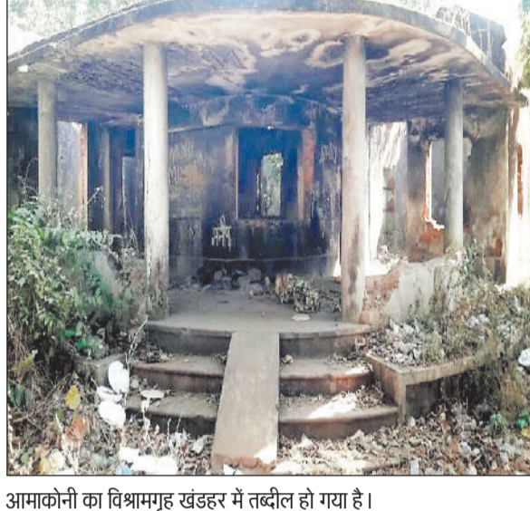
अमाकोनी का विश्रामगृह खंडहर में तब्दील हो गया है।

जल संसाधन विभाग द्वारा पुटका जलाशय केमाल में स्टील का कार्य किया गया है और विभाग के सभी क्षतिग्रस्त सरकारी क्वार्टरों को, कार्यालयों को नए सिरे से बनाने शासन को प्रोजेजल तो भेजा गया है। इसके अलावा क्षेत्र के विकास के लिए लातनाला में रिजल्टी एनोकेट बनाने के लिए लातल 7 करोड़, सारांगढ़ घोघरा नाला में स्टांपडेम बनाने के लिए 2.80 करोड़ और पुटकानाला के इस्टपडीह माइजर के कार्य के लिए 1.40 करोड़ का प्रस्ताव शासन को भेजा गया है। खस बात यह है कि वर्षों से खंडहर में तब्दील अमाकोनी रेस्ट हाउस के लिए अब तक शासन को किसी प्रकार का कोई प्रस्ताव नहीं भेजा गया है।